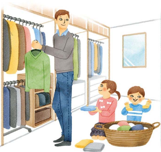
家族みんなで使うファミリークローゼットなら、みんなの衣服や持ち物の状況がひと目でわかります。広めのウォークインクローゼットが最適。

リフォームの予定があるなら、見通しがよく、みんなで料理のできるアイランドキッチンがおすすめ。ファミリークローゼットも家事シェアしやすいと人気です。