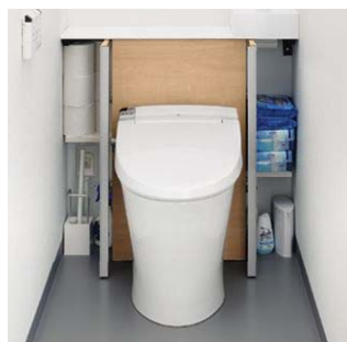
写真)リフォレ、キャビネット仕様:1型

タンクをキャビネットで隠し、収納として使うことができます。お掃除道具などをしまえて空間がすっきりします。